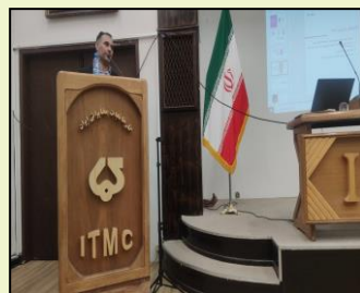
رویداد فناوری های نوین هوشمندسازی در صنایع با همکاری اداره کل ICT استان و مرکز آموزش جامع علمی کاربردی شرکت کارخانجات مخابراتی ایران