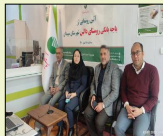
مراسم افتتاحیه باجه بانکی دالین در شهرستان سپیدان