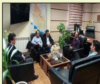
جلسه بررسی پیشبرد پروژه های همراه اول در شیراز