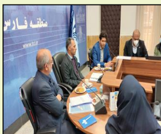
جلسه شورای راهبری توسعه ارتباطات استان فارس با حضور جانشین استاندار در شورای فضای مجازی استان