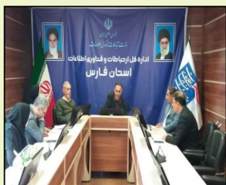
جلسه کارگروه دفاتر پیشخوان خدمات دولت و بخش عمومی غیردولتی استان فارس