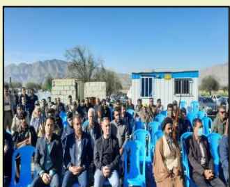
شرکت در یادواره شهدای عشایر استان فارس در شهرستان کازرون به مناسبت سالگرد پیروزی شکوهمند انقلاب اسلامی